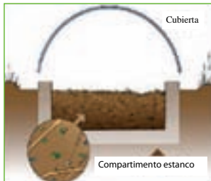
Sección transversal de Phytobac®

La presencia de productos fitosanitarios en las aguas superficiales es un problema al que se enfrentan todas las partes implicadas: los productores, los usuarios y las autoridades. Su origen son las fuentes de contaminación difusas o puntuales. Recientemente se ha identificado de forma inequívoca la importancia de éstas últimas, sobre todo porque a menudo son el reflejo de prácticas inadecuadas o falta de conocimientos. Si no se tratan los residuos de productos fitosanitarios en efluentes (restos de mezclas de pulverización, agua de lavado de los tanques y rociadores, desbordamiento de tanques) aumenta el riesgo de contaminación por fuentes puntuales.