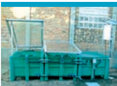
Phytobac® "Volumen pequeño"

Este Phytobac®, instalado sobre una base de hormigón, es adecuado para tratar grandes volúmenes de efluente y tiene una capacidad de 2 a 10 m 3 , según las necesidades.