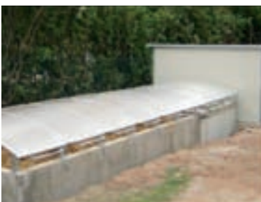
Phytobac® "Gran Volumen"